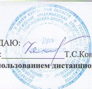
График мероприятий по организации обучения с использованием дистанционных технологий