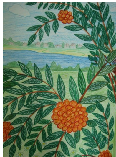
Районный этап детского рисунка, посвященного Всероссийской сельскохозяйственной переписи 2016 года «Я рисую Зауралье»