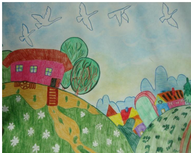
Всероссийский конкурс детских рисунков «Я и моя семья на даче»